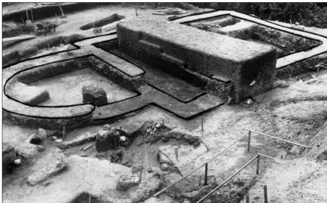
obr. 3 Staré Město, poloha „Na Valách“. Objev základů velkomoravského kostela v roce 1949.

Staré Město, Flur „Na valách“. Freigelegte Grundmauern der grossmährischen Kirche im Jahre 1949.