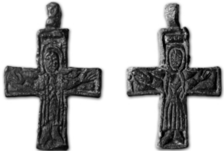
obr. 6 Staré Město, poloha „Dvorek“. Olověný závěsný křížek s oboustranným vyobrazením ukřižovaného nalezený v roce 1992.

Teilnehmer des Kolloquiums „Altstädter Jahresverdächtnisse“ während des Vortrags von Luděk Galuška im Jahre 1988.