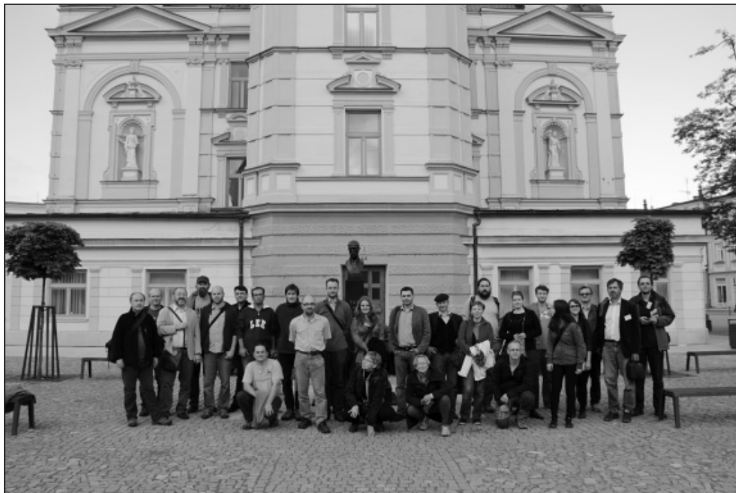
Obr. 1 Účastníci konference FUMA konané 5.–7. června 2013 v Uničově.

Když se dnes ohlédneme za tím, co archeologie dokázala k poctě uničovského výročí předložit, snadno vyjmenujeme témata, o nichž bychom rádi věděli víc. Tak už to bývá, s jídlem roste chuť. V případě Uničova ale stačí, aby se rozjetý mechanismus nezastavil a dál se soustavně zabýval všemi aspekty městské problematiky – které vyplývají třeba právě z uničovských listin. Ostatně shodně přání platí pro celou městskou archeologii doby preventivní.