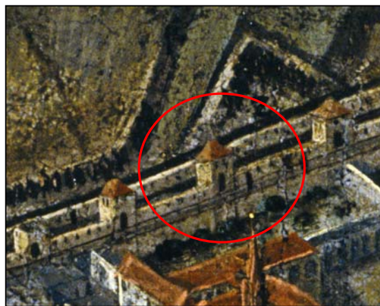
Obr. 2 - výřez z veduty H. B. Bayera a H. J. Zeisera, Obléhání Brna Švédy 3. května až 20. srpna 1645, olej na plátně, uloženo v MuMB, inv. č. 2285, vyznačen dokumentovaný úsek.