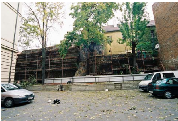
Obr. 1 - pohled na hradbu v průběhu rekonstrukce

V průběhu prací na zajištění torza středověkých městských hradeb (očistění, zpevnění koruny zdiva a přespárování) na dvoře domu Husova 10 (obr. 1) byla 27. 11 a 4. 12. 2003 provedena společností Archaia Brno o. p. s. jeho kresebná, písemná a fotografická dokumentace. Základním úkolem terénní části výzkumu byla dokumentace městské hradby před její renovací, která některé významné informace skryla.