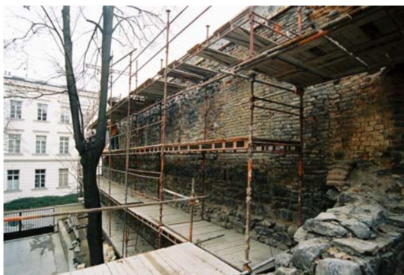
Obr. 4 - hradba v průběhu rekonstrukce

použití stejného stavebního materiálu a pojiva jako hlavní hradba, a proto nemůžeme vyloučit jejich současný, respektive rychle po sobě následující vznik. V horní části hradby nad předpokládanou věží bylo dokumentováno několik fází cihelných a smíšených konstrukcí, které patrně souvisely s podobou její příměstské části.