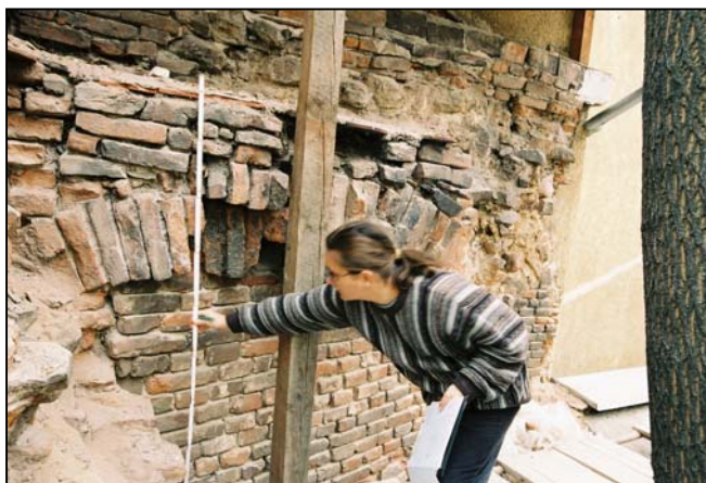
Obr. 3 – dokumentace hradby.

Při rekonstrukci torza středověkých městských hradeb byl archeology dokumentován přibližně 37,00 m dlouhý úsek kamenné hradby, zděné z velkých kamenů a bloků. Středověká část hradby je na svém nejvyšším místě zachována do úrovně téměř 7,50 m. Na vnější straně je kolmo na tuto hradbu přizděna zeď představující torzo hranolové hradební věže. Je zděna stejným způsobem, za